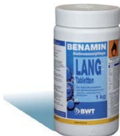
1 kg Dose