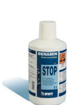
1 Liter Flasche