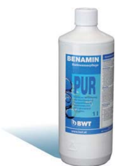
1 Liter Flasche