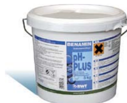
5 kg Eimer