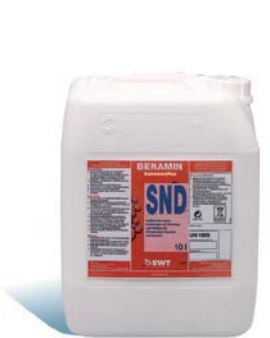
10 Liter Kanister