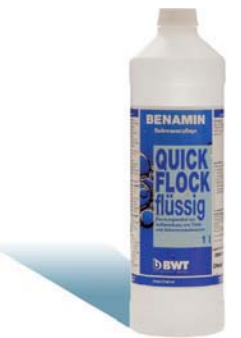
1 Liter Flasche