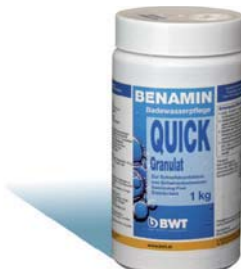
1 kg Dose