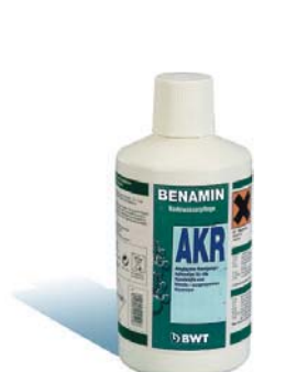
1 Liter Flasche