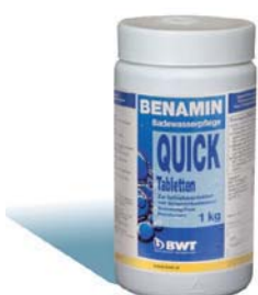
1 kg Dose