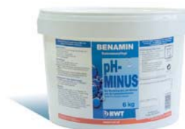
6 kg Eimer