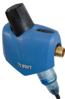
DIAGO AHA 3/4" – 5/4"