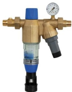
DIAGO HWS-A 3/4" – 1"