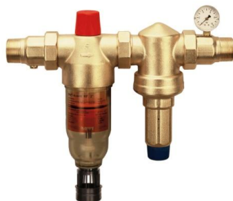
DIAGO HWS-A 6/4" – 2"