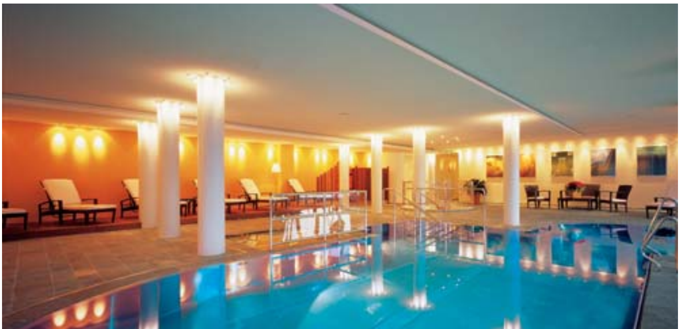
Schwimmbad Desinfektion, Inaktivierung von Viren, Abbau von organischen Verunreinigungen

Der Aufbau der Anlagen, die Einrichtungen für Bedienung und Betriebsüberwachung sowie die Sicherheitseinrichtungen entsprechen den Anforderungen der DIN 19627 sowie den einschlägigen VDE-Vorschriften. Die Einhaltung dieser Vorschriften wurde vom TÜV überprüft und diese Prüfung mit dem GS-Prüfzeichen Nr. S2011131, sowie die EMV-Prüfung für die Baureihe 25-700 mit dem Prüfzeichen Nr. V 21.1138 zertifiziert. Ozonerzeugungsanlagen der VU - L - W-Typenreihe sind Unterdruckanlagen, d.h. Lufttrocknung und Ozonerzeugung erfolgen im Unterdruck. Ein Ozonaustritt aus der Anlage ist bei diesem System völlig ausgeschlossen.